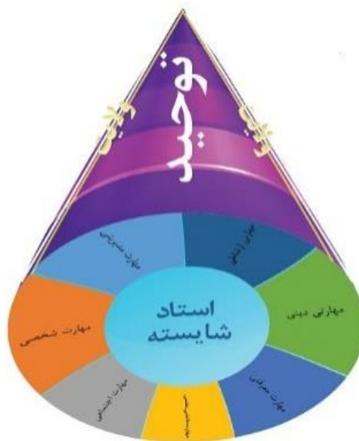
شکل ۳- مدل مراتب مضامین استخراج شده

با توجه به دو مراتب ۱ بودن انسان صفات او نیز ذو مرتبه خواهد بود. در مدلی که در این پژوهش توسعه داده شد، ابعاد و مضامین بیان گردید، اما مرتبه مضامین که می‌تواند از منفی بی نهایت تا مثبت بی نهایت باشد، بررسی نشده است. پیشنهاد می‌گردد طی پژوهشی کمی موضوع مراتب مضامین مورد توجه و بررسی قرار گیرد. برای رسیدن به این مهم یک شمای کلی، که مراتب را از صفر تا بالاترین مرتبه‌ی توحیدی، نشان می‌دهد ارائه شده است (شکل ۳ مدل مراتب مضامین استخراج شده). در این مدل تالی تلو توحید مقام ولایت است که برای رسیدن به آن باید از مسیر ائمه اطهار(ع) گذر نمود.