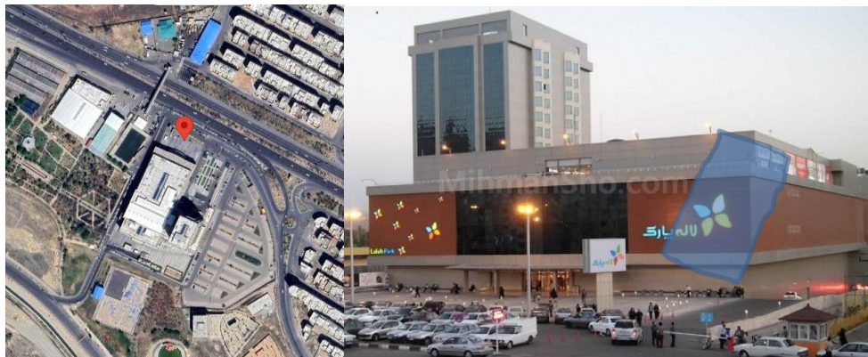
شکل ۳: نقشه جانمایی و تصاویر مجتمع تجاری اطلس و لاله پارک