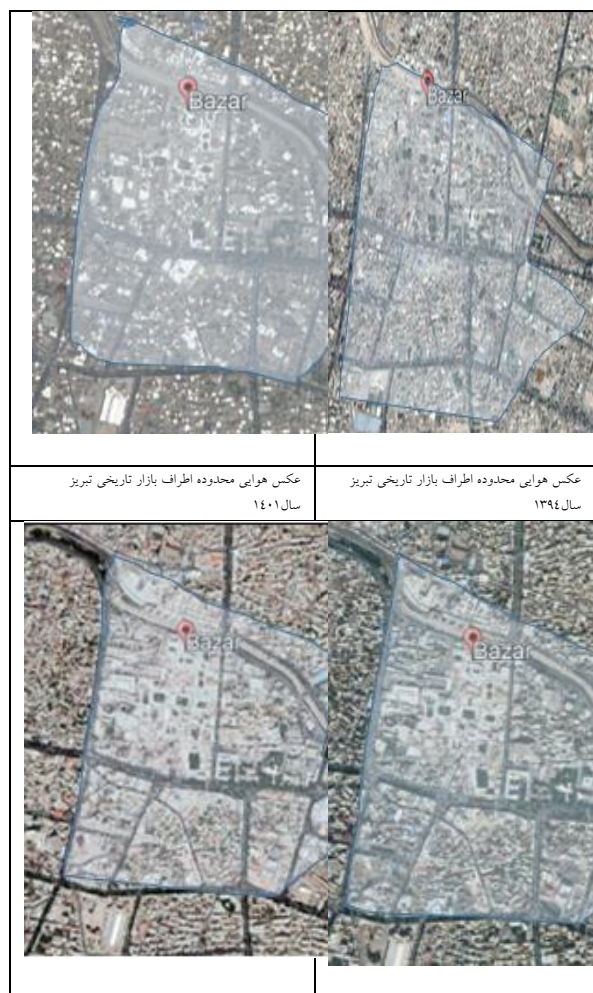
شکل ۲: نقشه ماهواره‌ای تحولات صورت گرفته در گذر زمان در محدوده بازار تاریخی تبریز

طبق شکل ۳ مجتمع تجاری اطلس و لاله پارک در حوزه شهرداری منطقه ۱ و ۵ شهر تبریز به عنوان نمونه بارز مراکز تجاری مدرن که براساس الگوهای بین‌المللی از مگامال‌ها ساخته شده‌اند، به منظور بررسی اصول و ارزش‌های بازتعریف شده در بازار از منظر اسلام، در نمونه بازار تاریخی و مراکز تجاری مدرن در جهت واکاوی تغییرات بوجود آمده و آسیب‌شناسی در راستای حرکت به وضعیت مطلوب براساس سبک زندگی اسلامی پرداخته شده است.