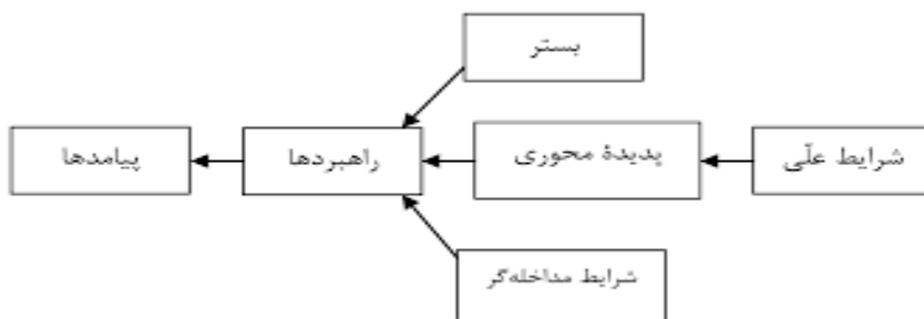
نمودار ۱: الگوی پارادایم در کدگذاری محوری

شامل «شرایط علی»، «شرایط زمینه ای»، «مقوله محوری»، «شرایط مداخله گر»، «راهبردها» و «پیامدها» می باشد که به شکل نظام مند الگوی پارادایم را تشکیل می دهند (علیزاده، ۱۳۹۷: ۵۹).