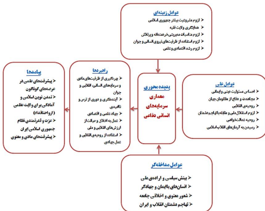
شکل ۱. مدل مفهومی معماری سرمایه‌های انسانی دفاعی متن بیانیه گام دوم انقلاب اسلامی

همان‌طور که در جدول ۱، نتایج حاصل از کدگذاری متن بیانیه گام دوم انقلاب اسلامی (کدهای باز، محوری و انتخابی) مربوط به معماری سرمایه‌های انسانی دفاعی مشخص شده است، در کل یافته‌ها حاکی از تعداد ۳۱۲ کدباز، ۶۳ زیر مؤلفه و تعداد ۲۴ مؤلفه در قالب شرایط علی، زمینه‌ای، مداخله‌گر، پدیده محوری، راهبردها و پیامدها ارائه شده‌اند؛ همچنین در شکل ۱ نیز به‌صورت مدل مفهومی نمایش داده شده است.