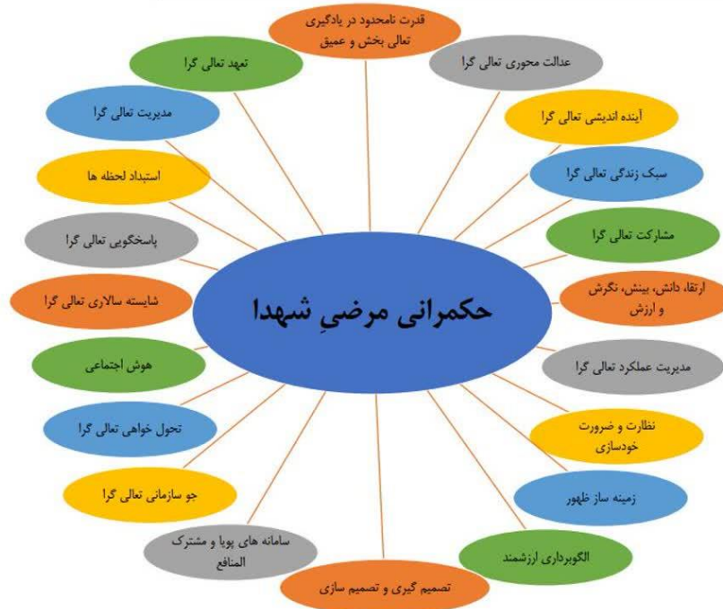
شکل ۲- مدل حکمرانی مرضی شهیدا

یافته‌های پژوهش نشان داد که آثار و وصایای شهید لک‌زائی دارای ۱۹۰ مفهوم (کد اولیه)، ۵۱ کد فرعی و ۲۰ کد اصلی است. کدهای اصلی شامل بینش، نگرش و ارزش، تصمیم‌گیری و تصمیم‌سازی، شایسته‌سالاری تعالی‌گرا، ارتقاء دانش و یادگیری تعالی‌بخش، عدالت‌محوری تعالی‌گرا، مدیریت عملکرد تعالی‌گرا، سامانه‌های پویا و مشترک‌المنافع، پاسخگویی تعالی‌گرا، آینده‌اندیشی تعالی‌گرا، نظارت و ضرورت خودسازی، جو سازمانی تعالی‌گرا، ایمان به خدا، سبک زندگی تعالی‌گرا، زمینه‌سازی ظهور، تحول‌خواهی تعالی‌گرا، مدیریت تعالی‌گرا، مشارکت تعالی‌گرا، الگوبرداری ارزشمند، هوش اجتماعی و تعهد تعالی‌گرا از منظر این فرمانده شهید است. یافته‌های این تحقیق با یافته‌های پیغان، یعقوبی و کیخا (۱۴۰۱)، قائمی، خزائی و یقینی (۱۴۰۰)، اقایروز (۱۴۰۰)، بهمنی و دیگران (۱۳۹۹) و نامدار جویمی (۱۳۹۹) همسو است. همچنین لک‌زائی و شهبازیان (۱۴۰۰) عنوان کرده‌اند که بازشناسی مؤلفه‌های قرآنی آن در سیره شهید سلیمانی با توجه به ارکان حرکت حکمرانی مقاومت، از لوازم انتظار متعالی و مبتنی بر