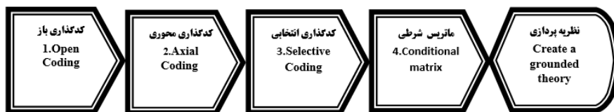
شکل ۱. انواع کدگذاری در روش گراندد تئوری

ویژگی‌های انتخاب مقوله محوری را موارد زیر بیان می‌کند: