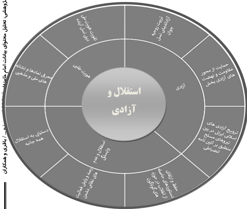
شکل ۳. شمس جهت‌ساز و راهبردی در حوزه استقلال و آزادی

ابعاد و مؤلفه‌های دستیابی به استقلال و آزادی از اندیشه و بیانات امام خامنه‌ای (مدظله‌العالی)