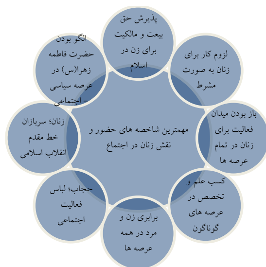
شکل ۳: مهم‌ترین شاخص‌های سبک زندگی اجتماعی در حوزه زنان (نگارنده)

آنچه تاکنون درباره‌ی جنبه‌های مختلف سبک زندگی زنان در جامعه‌ی اسلامی آمد را می‌توان به‌طور خلاصه در نمودار زیر این‌گونه نشان داد: