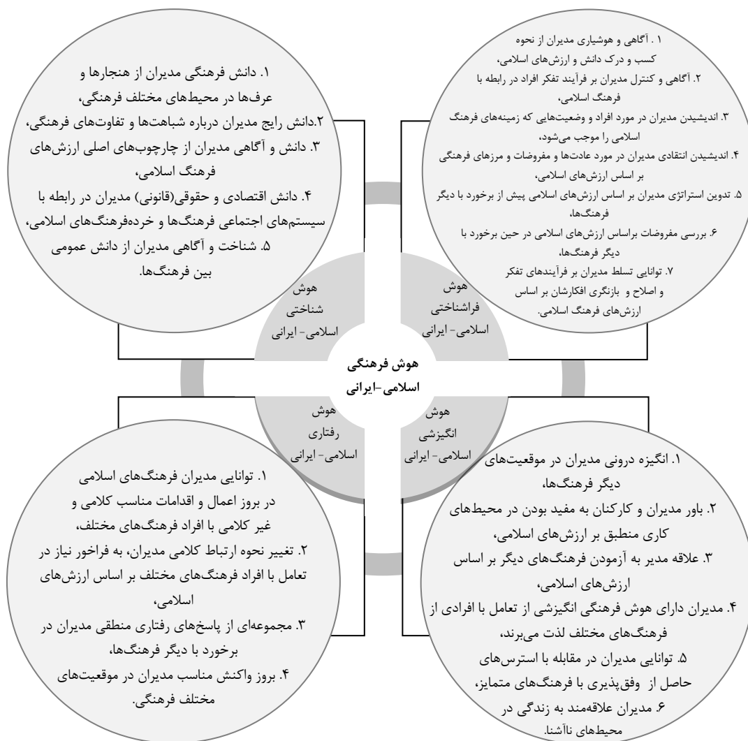
شکل شماره ۲: چارچوب نظری پژوهش