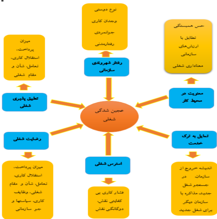
شکل شماره ۳. مدل مستخرج از فراترکیب عوامل مؤثر بر عجین شدن شغلی