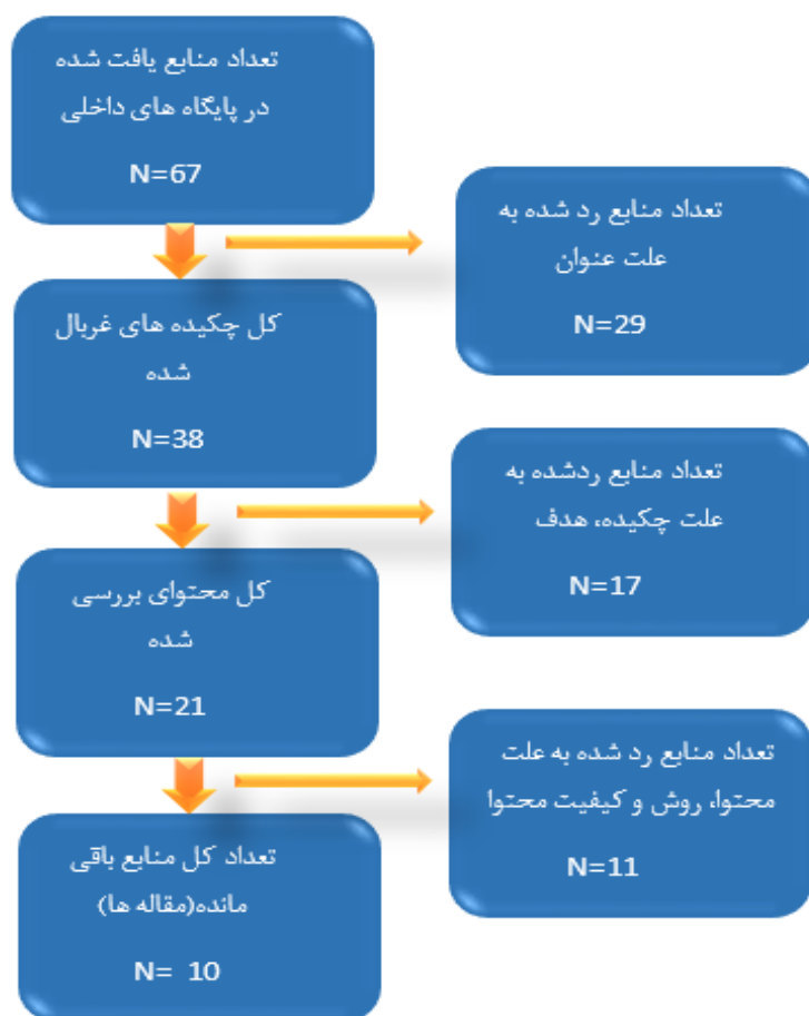
شکل شماره ۲: الگوریتم انتخاب مقاله های نهایی